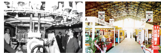
▶ 참관 중인 박정희 대통령, 국제자동차정밀기기전(1985)