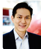
박경호 교수 카이스트