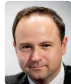
디에고 우르디놀라 선임이코노미스트 월드뱅크