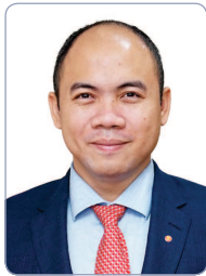
기조연설2 궁혹 아세안 사무부총장