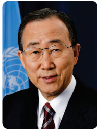
기조연설1 반기문 전 UN사무총장